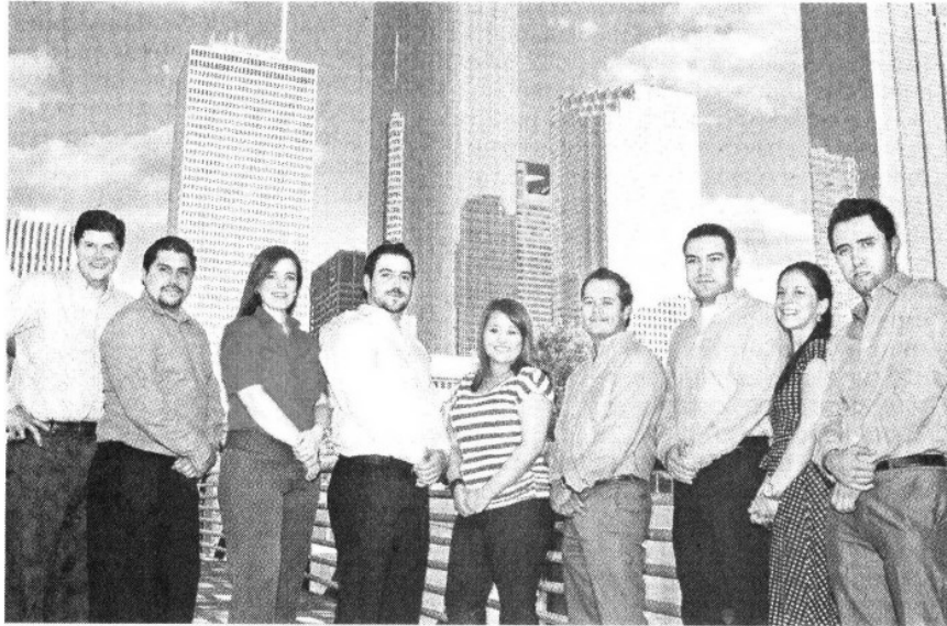
Equipo de Monex Securities.