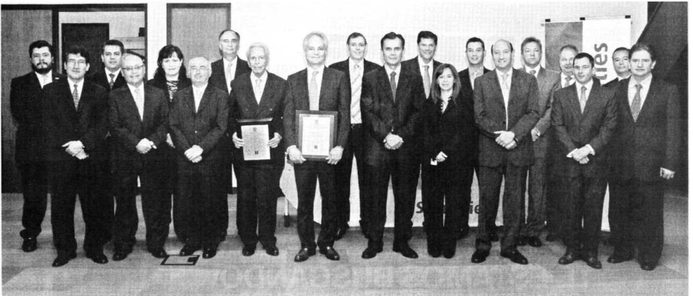
Equipo directivo de Monex.