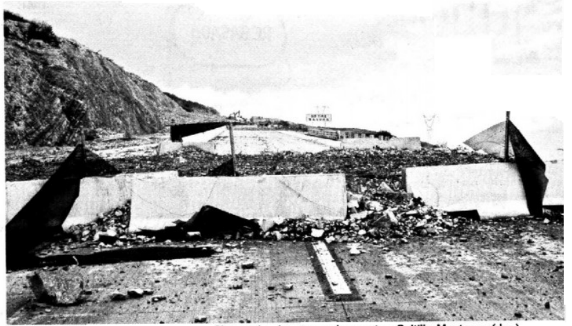
ESTRAGOS. Alrededor de 11 carreteras de Coahuila registran daños, entre ellas la vía federal 57, en el tramo Los Chorros (izq.), así como la carretera Saltillo-Monterrey (der.).