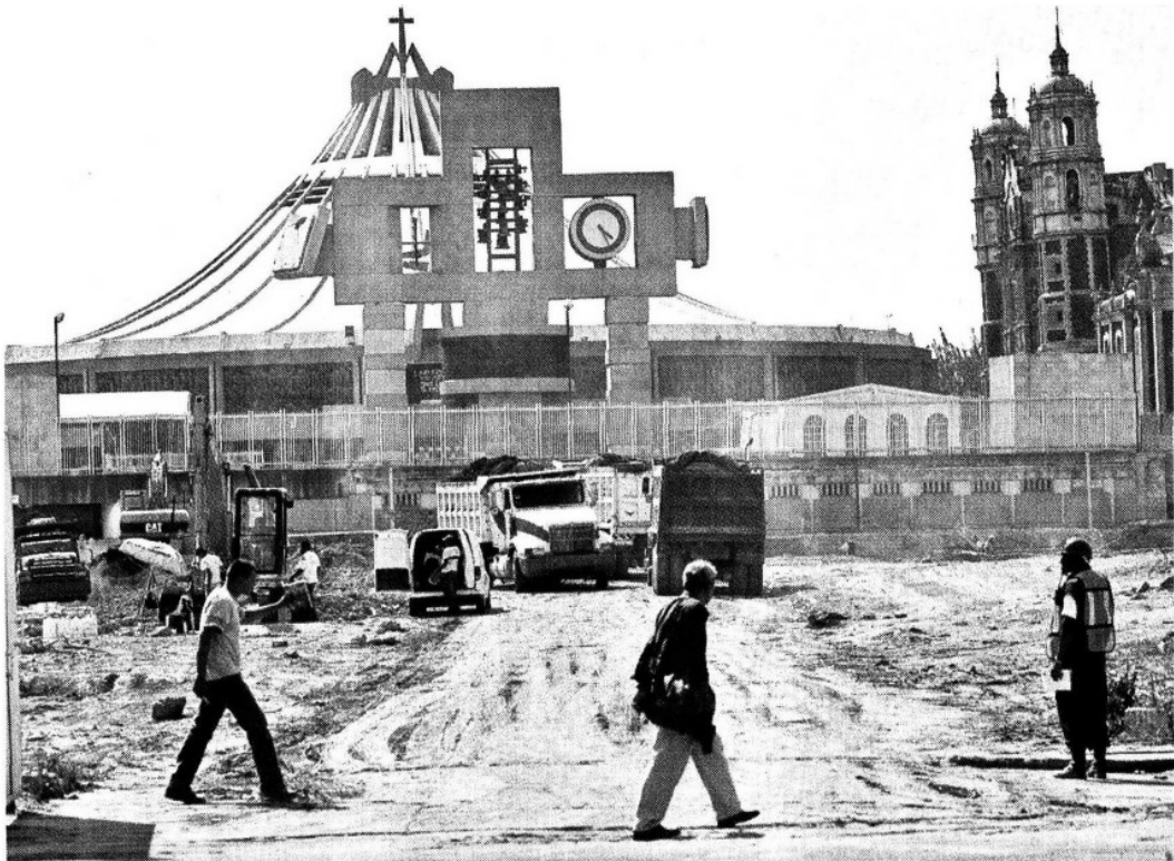
> El Fideicomiso de la Plaza Mariana retomó recientemente los trabajos para edificar cuatro inmuebles a un costado de la Basílica de Guadalupe, que debieron estar terminados desde 2002.

Las tareas de mejora se realizarán en dos etapas, pues será una obra bianual. La primera será de septiembre a diciembre, para dar pie a todas las festividades, y la segunda de enero a mayo.