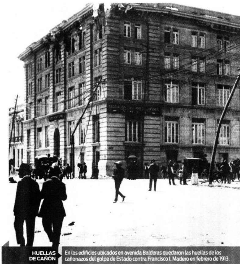
HUELLAS DE CAÑÓN

En los edificios ubicados en avenida Balderas quedaron las huellas de los cañonazos del golpe de Estado contra Francisco I. Madero en febrero de 1913.