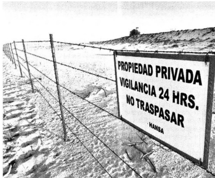
› Terrenos cercados se aprecian en el Parque Nacional Marino de Baja California Sur.