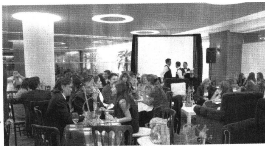
Lujo y confort se reúnen en las áreas de esparcimiento