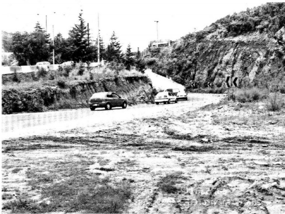
> En uno de los retornos a desnivel de la Jiménez Cantú se aprecia la brecha de lo que será el Libramiento.