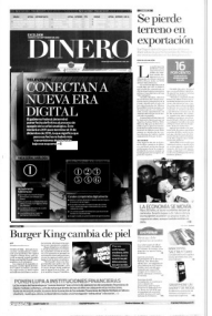
Ilustración: Angeles Barajas