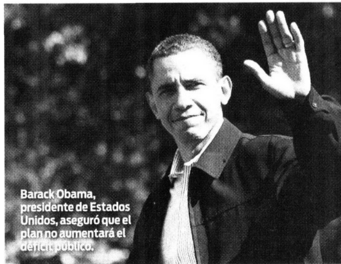
Barack Obama, presidente de Estados Unidos, aseguró que el plan no aumentará el déficit público.

“Es un plan que se pagará completamente. Esto no aumentará el déficit público. Vamos a trabajar con el Congreso para ver esto”, dijo. >7