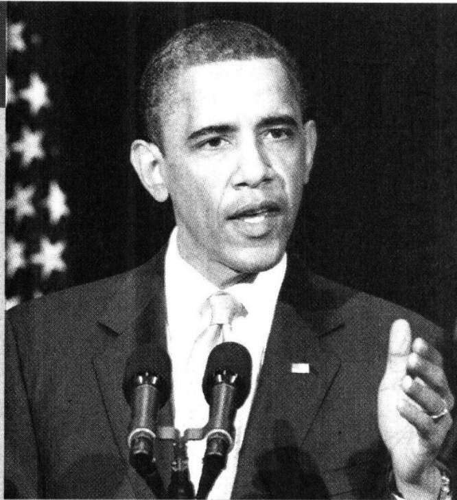
El presidente de EU, Barack Obama, apuesta por más plazas.