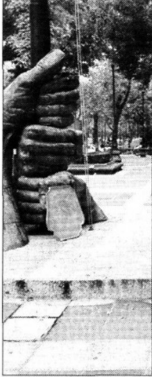
ALONSO GAITI EGOS