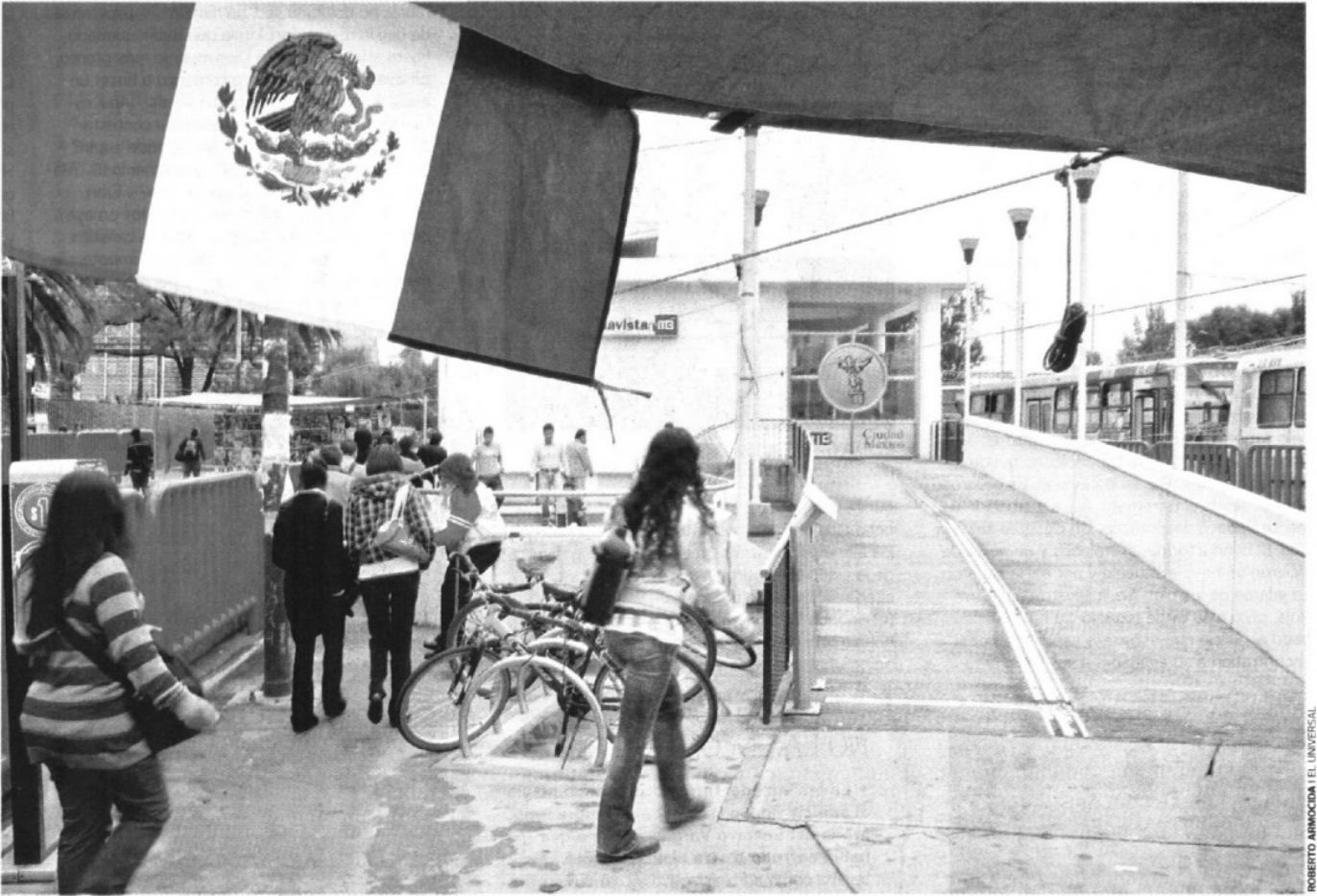
RETRASO. La estación alterna del Metrobús en Buenavista está fuera de servicio. El informe señala que entraría en operación en el segundo semestre de 2010