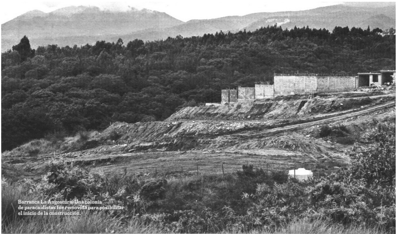
Barranca La Angostura. Una colonia de paracaidistas fue removida para posibilitar el inicio de la construcción.