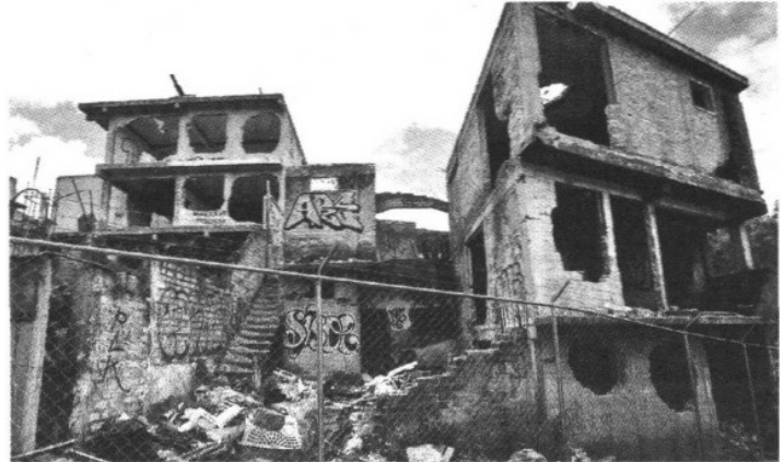
Ruinas. Las casas quedaron inhabitables tras el desalojo.

Mientras el proceso sigue su curso en tribunales –ya se les negó la suspensión provisional de las obras–, la construcción de la Supervía Poniente continúa. •