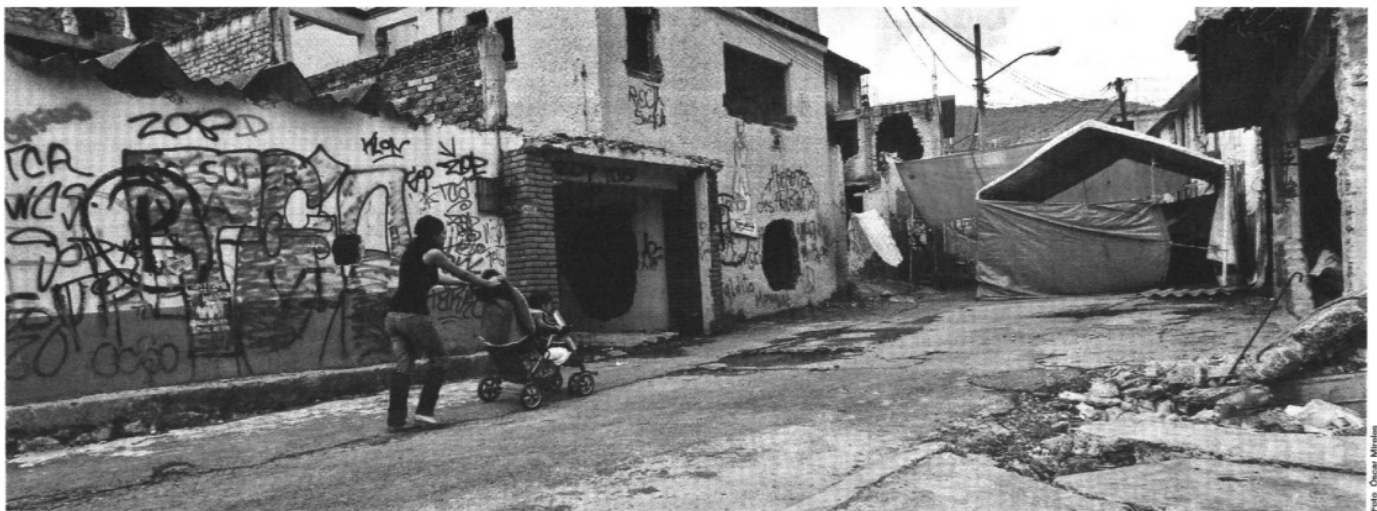
Calles desoladas. La colonia Malinche luce prácticamente desierta tras la expropiación de 2 mil 400 metros cuadrados.