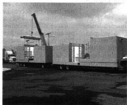
Módulos prefabricados o celda para cárceles.