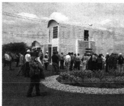
Modelo de casa de dos pisos.