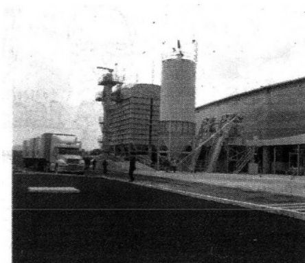
Fachada de la planta de Casaflex.