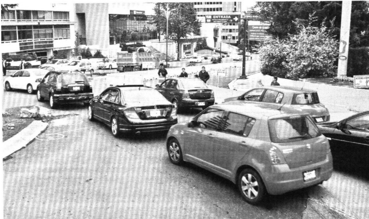
> Durante la mañana de ayer la circulación en el punto de obras fue fluida; las desviaciones en la circulación se extenderán al menos tres meses.

» Libran automovilistas primer día de bloqueo en 300 mts de la arteria; ponen 20 agentes de Tránsito para agilizar circulación y colocan 7 anuncios preventivos en zona de construcción