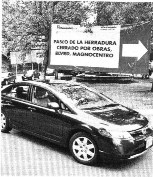
> Automovilistas pidieron que los anuncios sean instalados con anticipación a la zona de obras.

MUCHO OJO. La vialidad en torno a Interlomas se complica por las tardes.