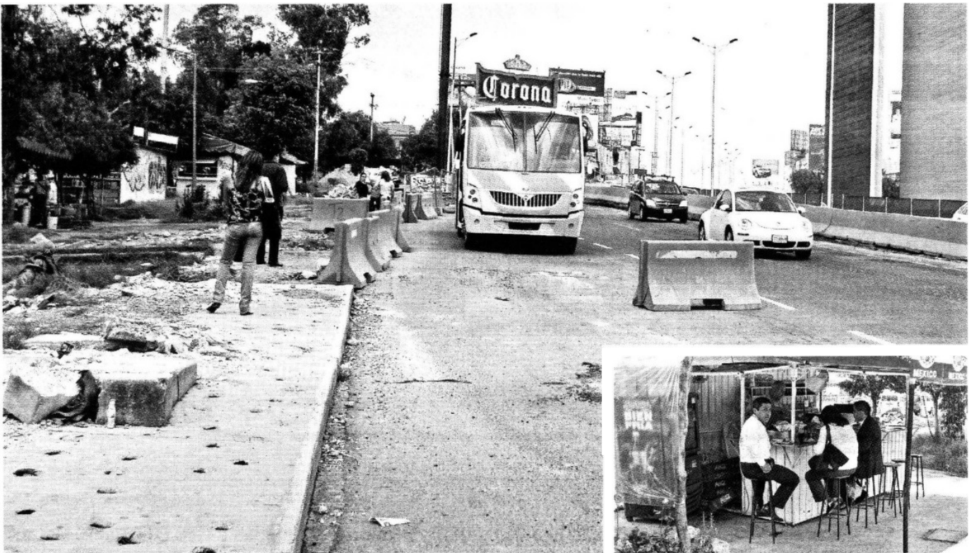
¡ABRAN PASO! Los trabajos, que se realizan en la lateral del Periférico Norte, requerirán adecuar un área verde y retirar comercios ambulantes.