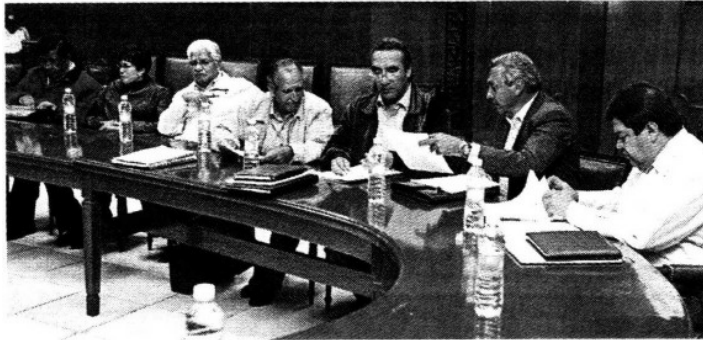
► En el encuentro se levantó una minuta, pero no se firmó ante notario.