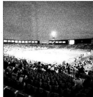
La nueva cancha de Territorio Santos Modelo.