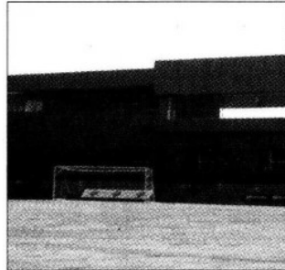
El TSM cuenta con canchas de entrenamiento.