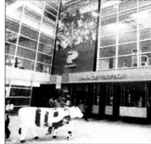
Además cuenta con un hotel y un centro comercial.