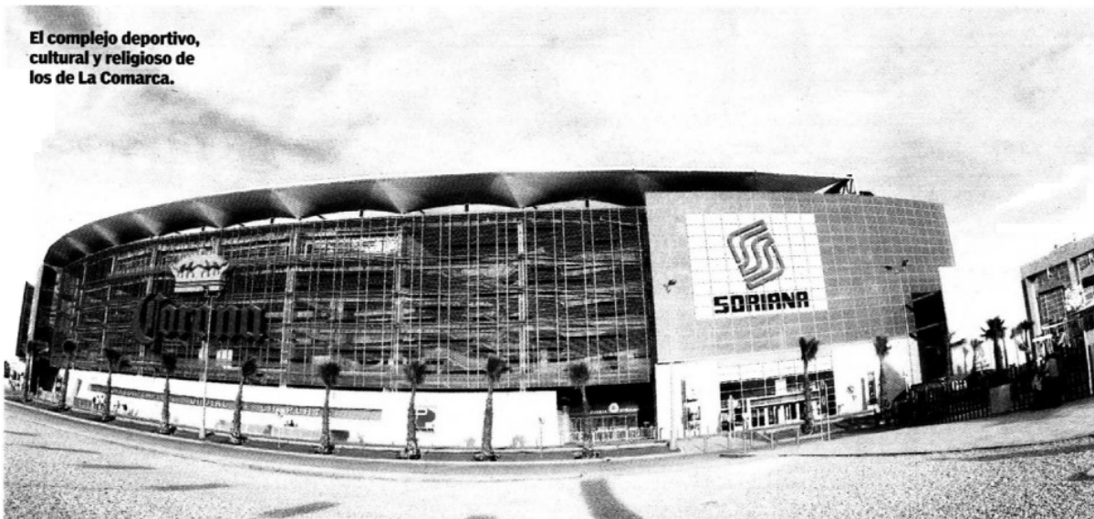
El complejo deportivo, cultural y religioso de los de La Comarca.