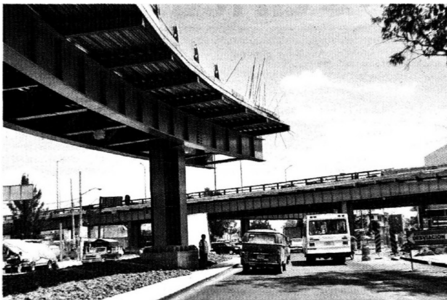
Al puente le falta un tramo para unirse con el otro

Explicó que en total son 22 las familias que viven en los predios referidos, las cuales se niegan a abandonar sus terrenos y ser reubicadas. ■ M