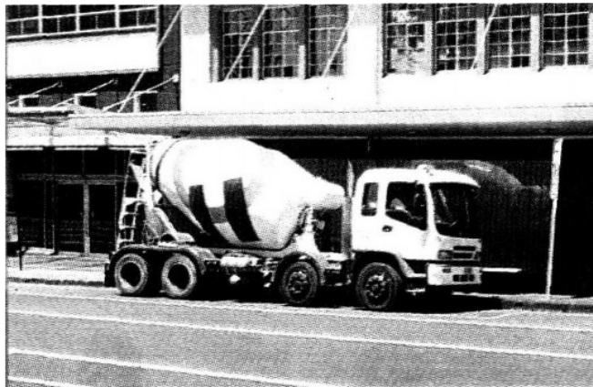
EMPRESA líder en el mercado.