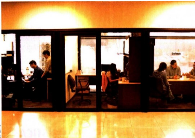
SE BUSCAN. Luego de 28 años de operar en Monterrey, Softtek señala que uno de los inhibidores del crecimiento de la región es la falta de talento.