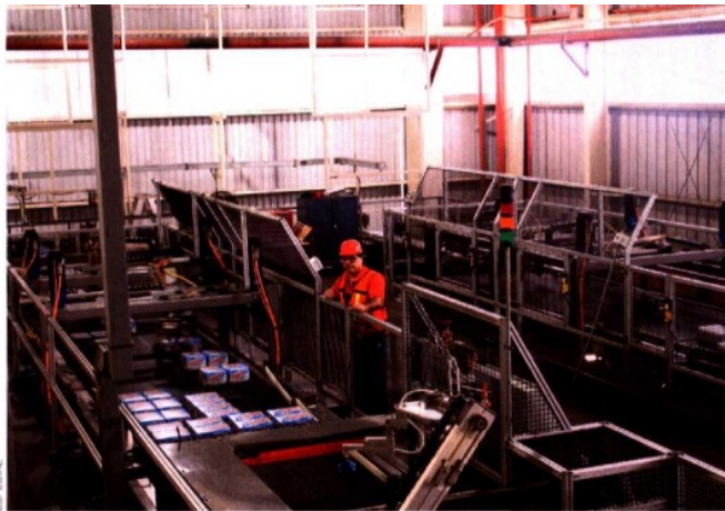
MULTIRREGIÓN. CCM no sólo tiene presencia en el noroeste de México, también posee una planta en Monterrey, Nuevo León.