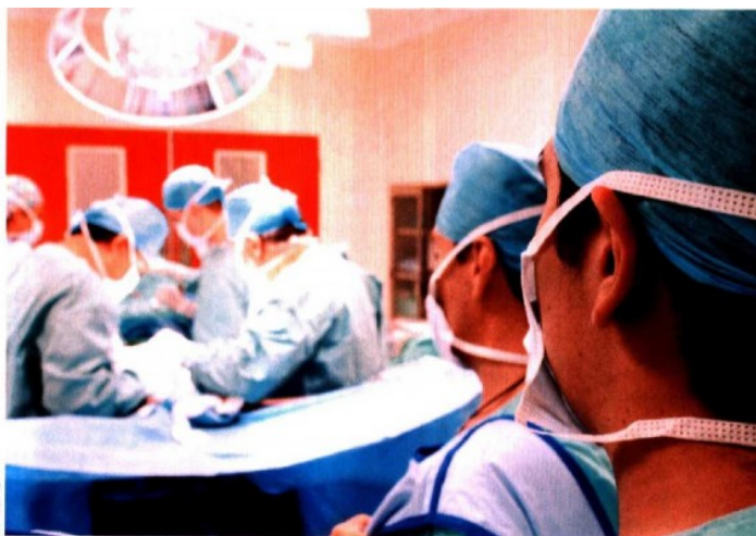
NUEVOS MERCADOS. El Centro Médico ABC tiene planes de extenderse al interior de la República en 2015.