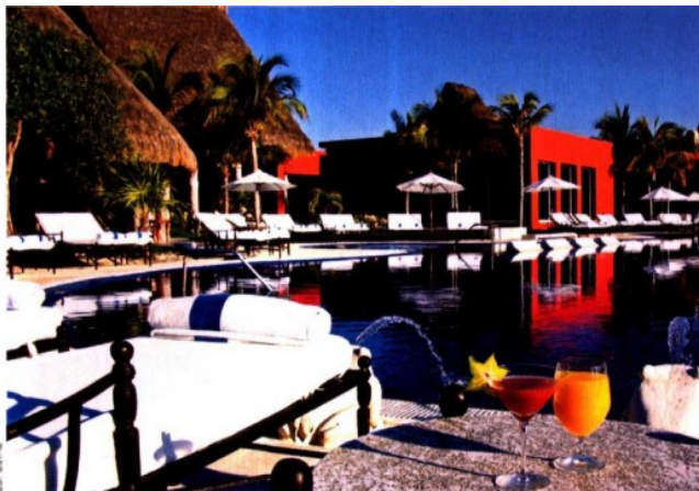
EN CRECIMIENTO. AMResorts abrirá en los próximos meses tres hoteles en Ixtapa Zihuatanejo, Cozumel y Manzanillo.