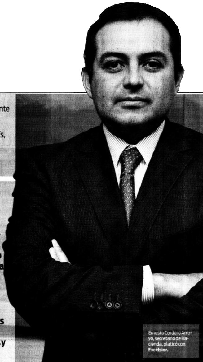
Ernesto Cordero Arroyo, secretario de Hacienda, platicó con Excelsior.

La dinámica de egresos que generan las pensiones estatales y las universidades públicas en el corto y mediano plazos, tiene preocupado al gobierno federal; por ello, plantea una verdadera reforma en finanzas públicas para enfrentar los retos de ingresos, al tiempo de desactivar los problemas financieros de los gobiernos locales y municipales