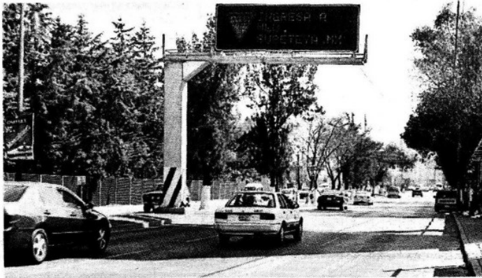
> Sobre Lomas Verdes está pendiente construir un retorno.