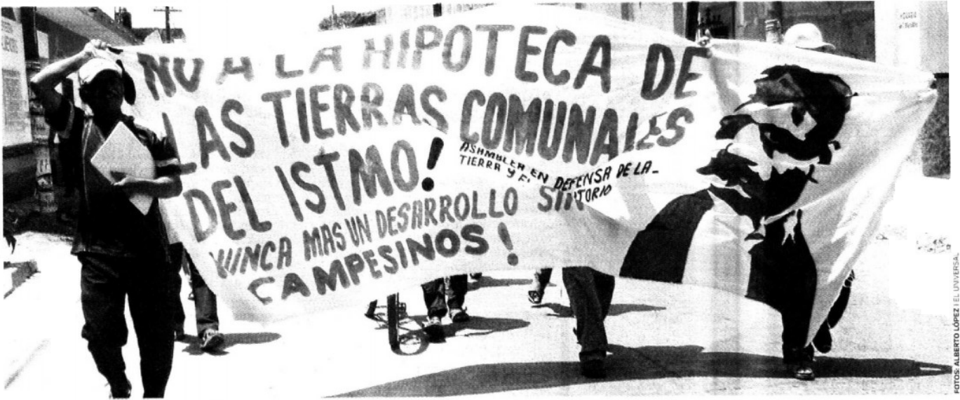
PRESIÓN. El Frente por la Defensa de la Tierra exige que el gobierno de Gabino Cué someta a consulta la ejecución de megaproyectos que están vinculados al proyecto Mesoamérica