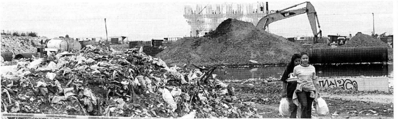
Relleno sanitario, catalogado como el segundo más grande del mundo.

Adelantó que se utilizarán rellenos sanitarios privados del Estado de México sólo por un tiempo, mientras se termina la construcción del CIRE de Tláhuac, el cual tardará más de un año en estar listo. ☒