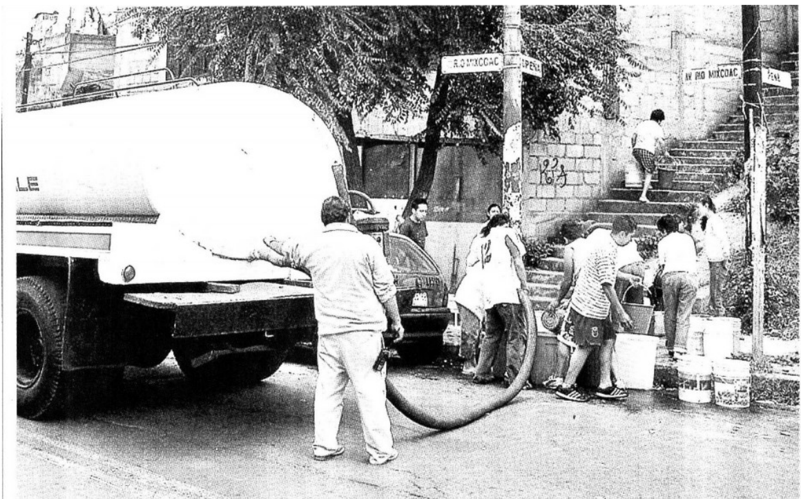
› En colonias como Lomas de Becerra, reciben agua sólo dos días por semana en sus tuberías y a través de pipas.