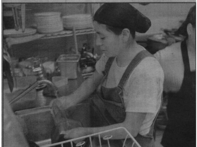
Tendrán que pagar lo que dice el recibo o abandonar el negocio; desde 2005 han tomado medidas para casi no gastar agua