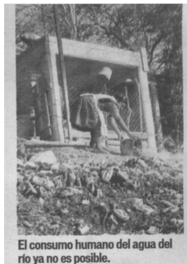
El consumo humano del agua del río ya no es posible.