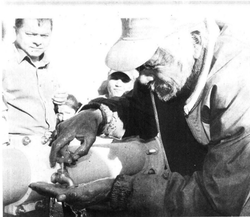
LÍQUIDO POTABLE Aún falta por dotar del servicio a 30 mil personas en el municipio