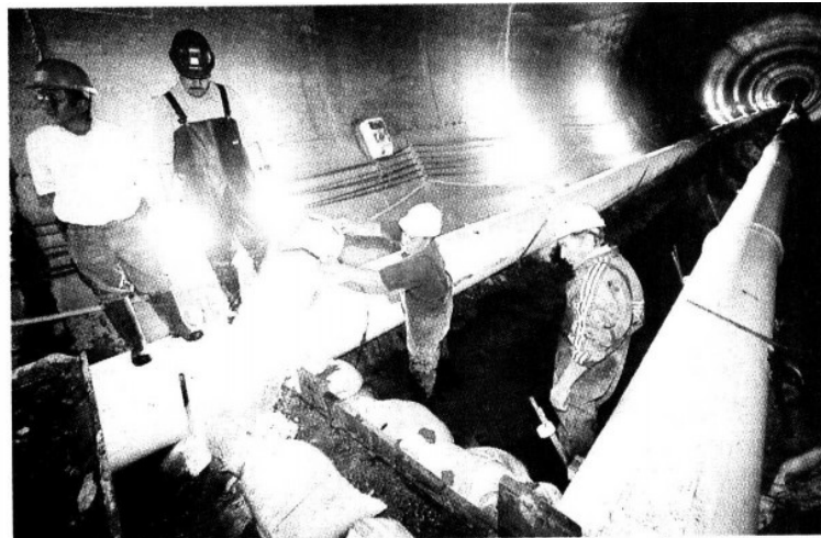
➤ Dos tubos se utilizan para capturar el agua que se está filtrando, y de esta manera tener seco el piso para realizar las reparaciones.