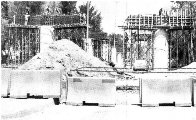
> El puente vehicular que se levanta en Circuito Río Churubusco y Eje 5 lleva un avance de 40 por ciento. La obra civil fue concluida y se construyen las traveses.