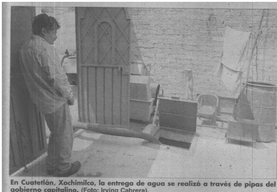
En Cuatetlán, Xochimilco, la entrega de agua se realizó a través de pipas del gobierno capitalino.

También se pueden comunicar al número telefónico 5062-2222 de Hóonestel y a la página electrónica www.contraloria.df.gob.mx