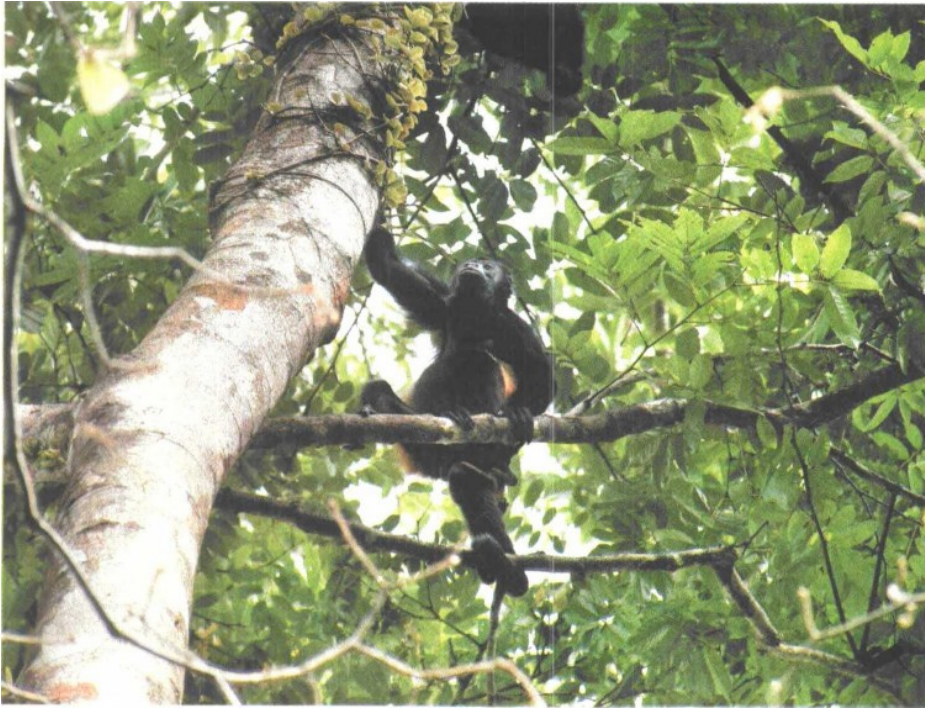
Selva y playas de Isla del Caño, una de las 160 áreas naturales protegidas en Costa Rica