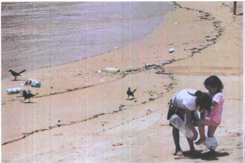
Playas de Acapulco, Guerrero