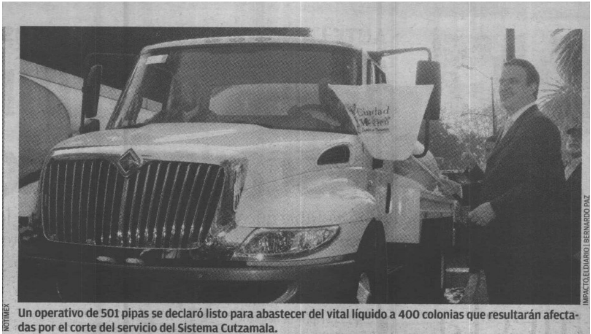
Un operativo de 501 pipas se declaró listo para abastecer del vital líquido a 400 colonias que resultarán afectadas por el corte del servicio del Sistema Cutzamala.