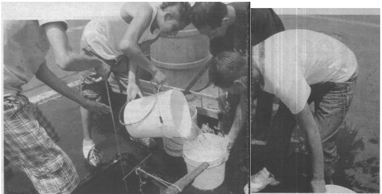
El mandatario capitalino calificó de provocador al funcionario federal, quien en la vispera dijo que el Gobierno del DF exageraba sobre el desabasto que ocasionará el tercer corte temporal de agua