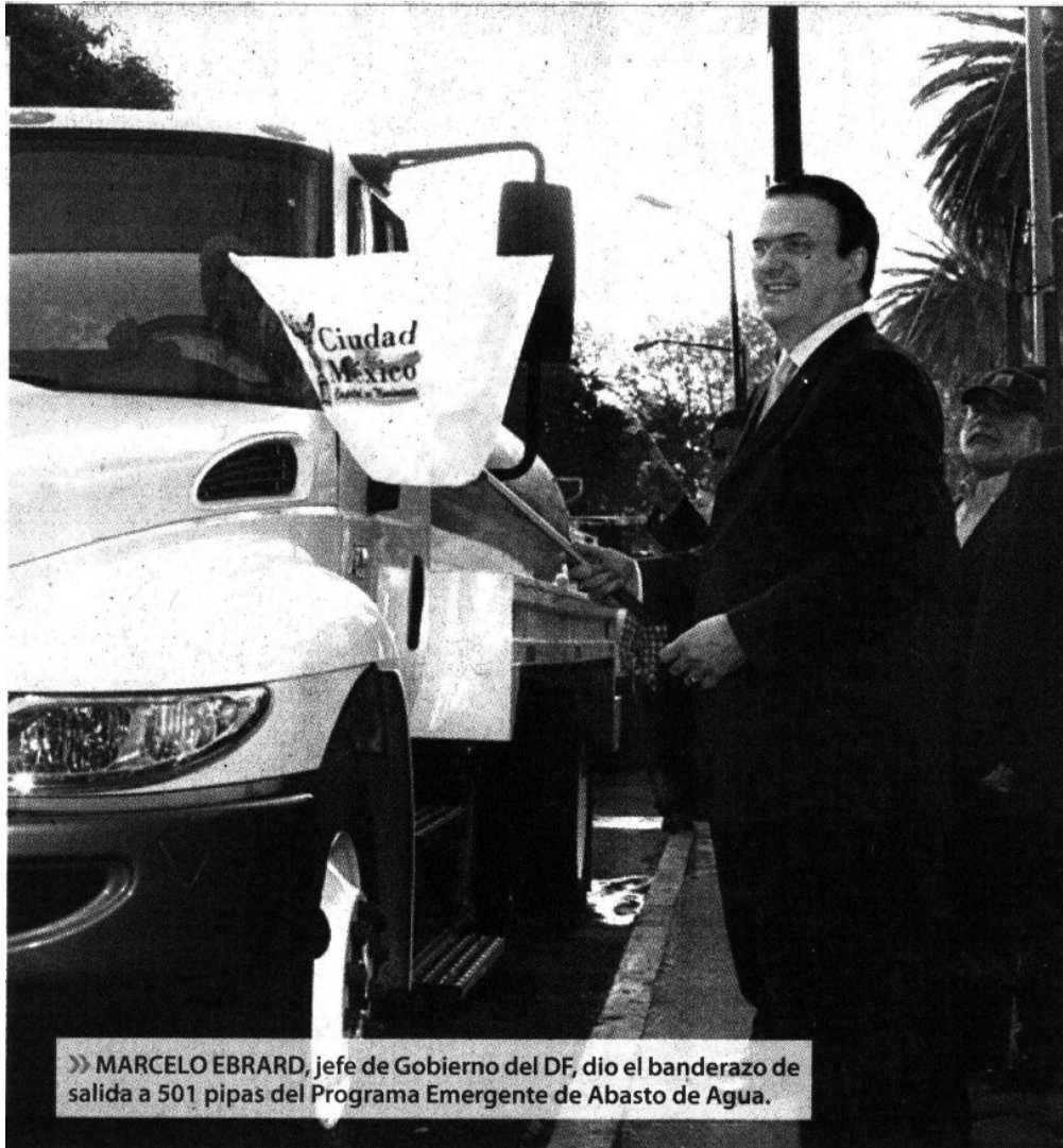
» MARCELO EBRARD, jefe de Gobierno del DF, dio el banderazo de salida a 501 pipas del Programa Emergente de Abasto de Agua.