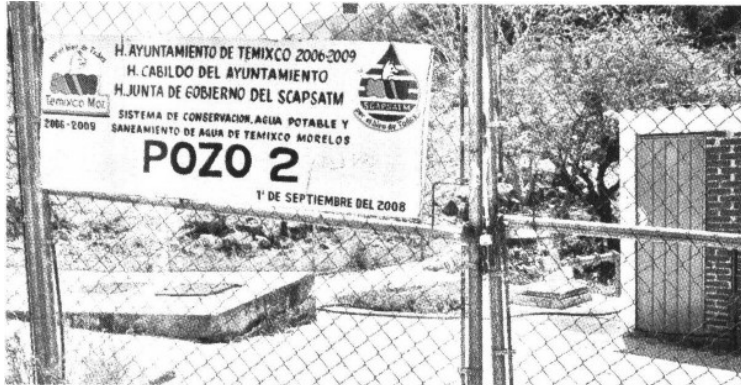
> En el pozo 2 del Fraccionamiento Burgos cuelga una manta del ayuntamiento.