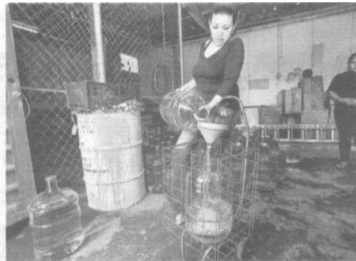
La delegación Iztapalapa también repartió agua purificada en garrafones.