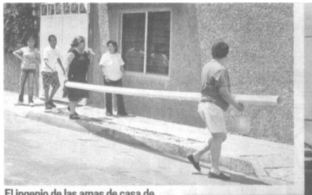
El ingenio de las amas de casa de Iztapalapa salió a relucir.