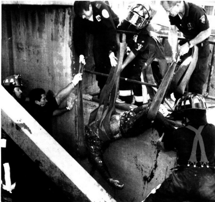
La muerte de 11 personas en el cárcamo de bombeo en Tula originó el nuevo enfrentamiento entre ambos gobiernos