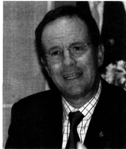
Luege 'prendió la mecha' al culpar al GDF del accidente ocurrido en Hidalgo

va para largo. Ojalá y subsanen esas diferencias por el bien de la ciudadanía.