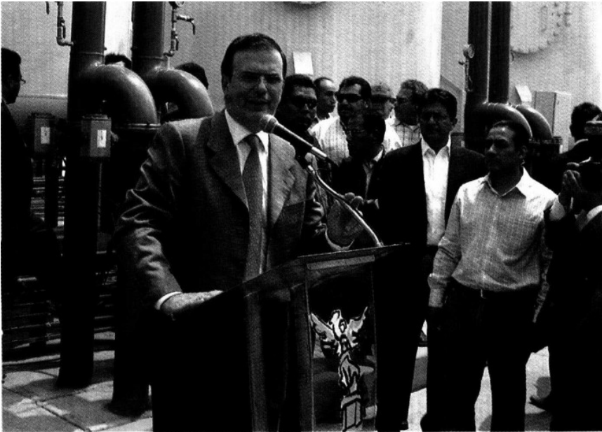
Al inaugurar la planta potabilizadora Acueducto Santa Catarina, Ebrard contestó a Luege: 'En lugar de trabajar, lo que hace es crear problemas'