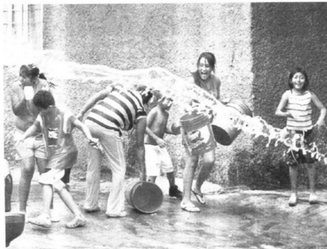
> Así tiraron el agua en el Campamento 2 de Octubre, en Iztacalco.

"A los güeyes de la cámara, moja a los güeyes de la cámara, vienen de 'orejas' (espías)", gritó un adolescente sobre la calle Granada, al tiempo que sus amigos lo secundaron con silbidos y mentadas hacia quienes los sorprendieron 'in fraganti'.