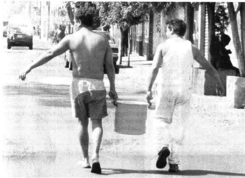
SERGIO SUÁREZ / EL UNIVERSAL