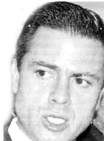
ENRIQUE PEÑA NIETO, GOBERNADOR DEL ESTADO DE MÉXICO.