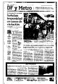
SUSPENSIÓN Los cortes se realizan bloqueando las tuberías visibles en las propiedades de los morosos