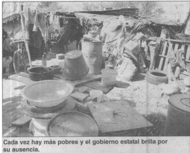
Cada vez hay más pobres y el gobierno estatal brilla por su ausencia.