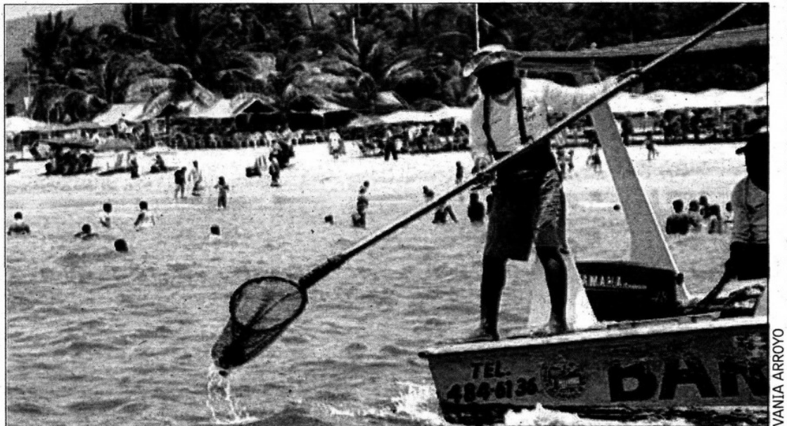
ASEO. En un recorrido por la bahía se constató que un grupo de trabajadores realizaba permanentemente trabajos de limpieza.