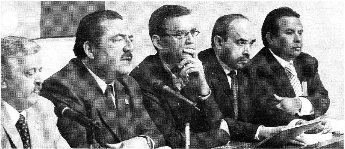
Las secretarías de Comunicaciones y Transportes, Educación, Energía, Hacienda, Agricultura y Ganadería, Conagua, Pemex Exploración e IMSS, las más irregulares.