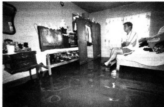
Vecinos afectados dijeron que ocuparán su tiempo en labores para sacar el agua y en la limpieza de sus muebles.