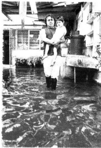
300 personas resultaron afectadas.

»» Desbordan lluvias el drenaje e inunda diez manzanas de la Colonia San José, en Tláhuac |