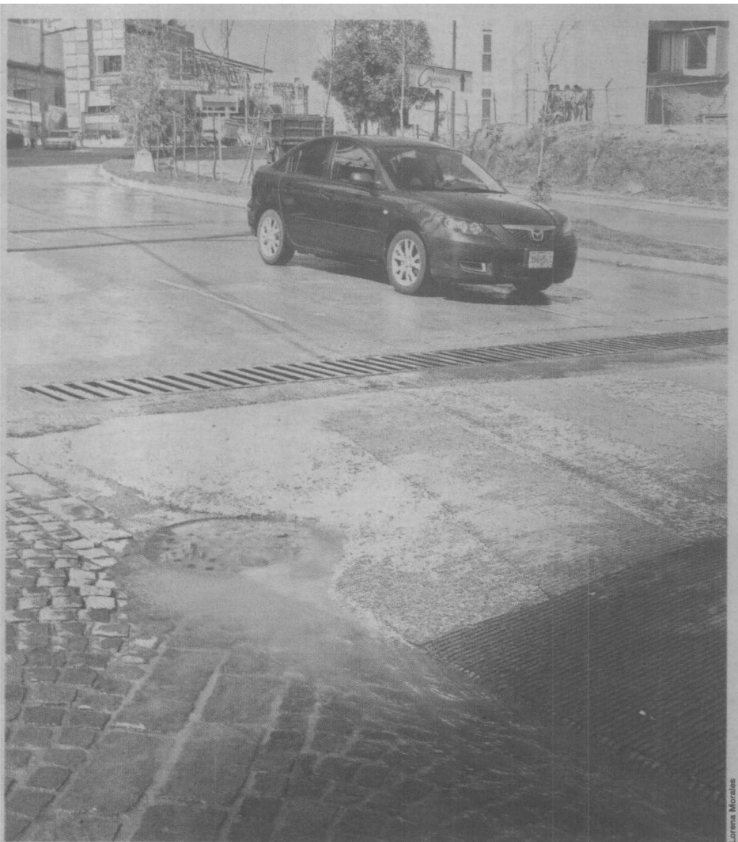
Las aguas residuales salen por las coladeras que se encuentran sobre la vialidad recientemente habilitada.