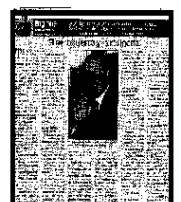
Se detiene el crecimiento del PIB?