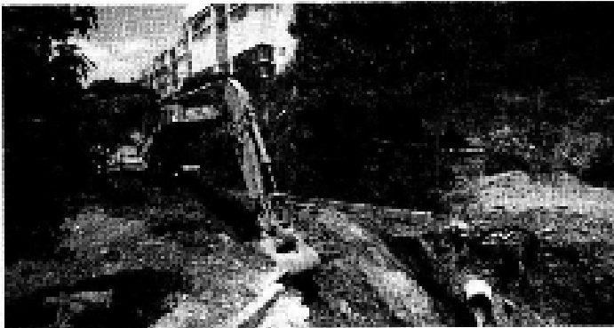
> Empleados de la CAEM abrieron ayer un canal de desahogue en la zona.