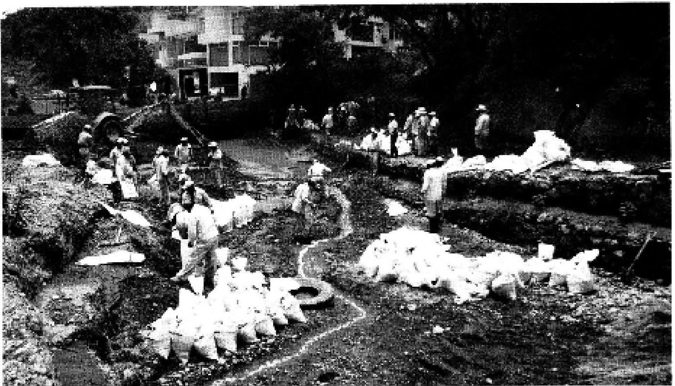
> Empleados de la Conagua trabajaron en el desaholvo del río que en temporada de lluvias afecta el condominio en Lomas Country Club.