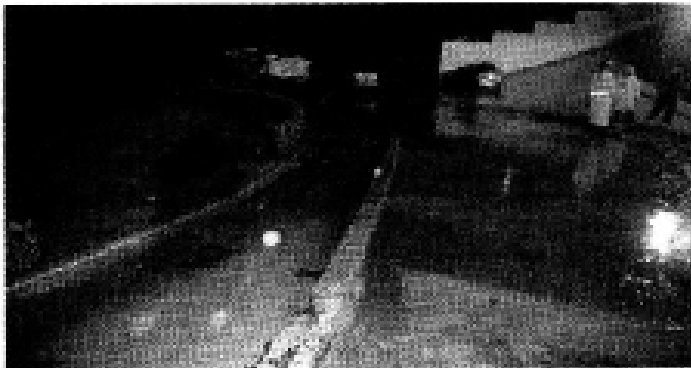
► En el residencial, que es localiza sobre la Avenida Club de Golf, se inundó parte del área comunal el 26 de junio.