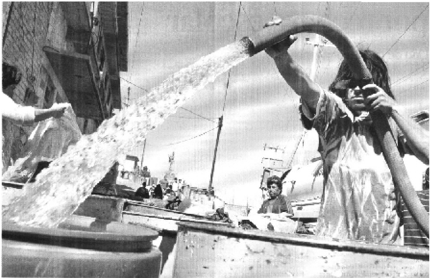
CAPACIDAD LIMITADA. La disminución en el caudal de Cutzamala se resintió sobre todo en las zonas altas de la capital. El titular del Sistema de aguas reconoció que el gobierno capitalino no cuenta con los recursos suficientes para dotar del líquido a 1.5 millones de personas si no se toman las medidas en los tanques de almacenamiento.

El Cutzamala surte 30% del agua que se consume en la ciudad. En total son 13 las delegaciones que obtienen líquido, con excepción de Milpa Alta, Xochimilco y Tláhuac.